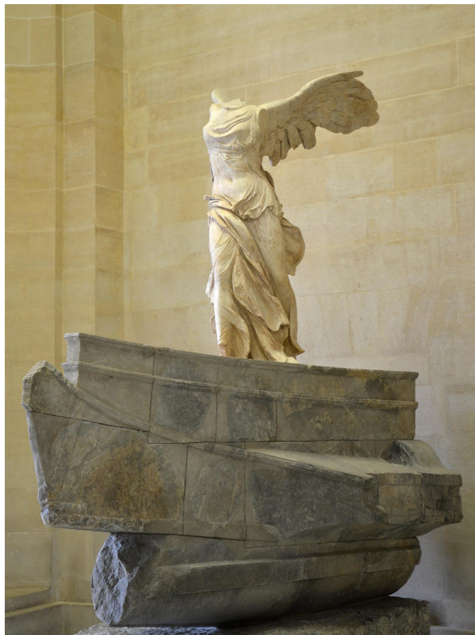
La Victoire de Samothrace